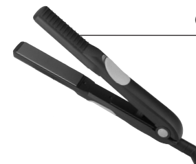
Chapa Taiff Look